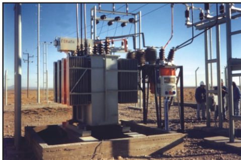
S.E.T. Cerro Dragón Panamerican Energy Chubut - Rep. Argentina