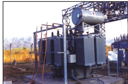
SETAR YACUIBA BOLIVIA S.E.T. (Subtransmisión)